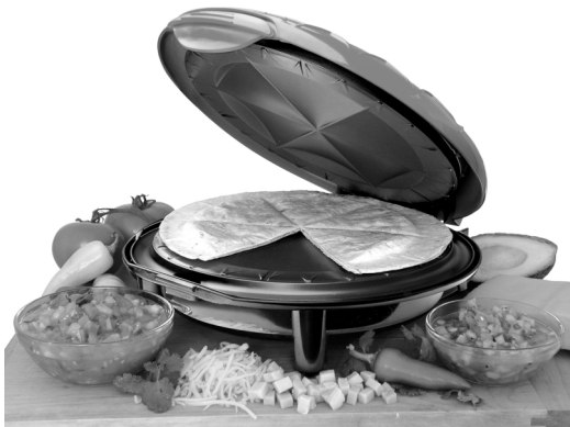
The ELECTRIC QUESADILLA MAKER™

Place the other tortilla on top and close the lid. Cook as directed for 3 to 5 minutes. Open lid with pot holder or oven mitt, serve with salsa or picante sauce.