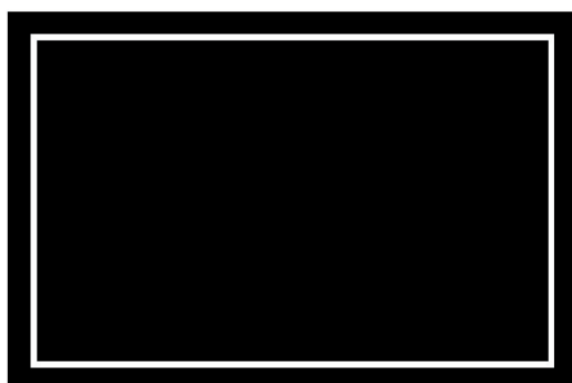
Flatscreen Display (Fixed Output)

P 3 for connecting to devices with high signal voltage e.g. CD players or flatscreen displays with fixed output.